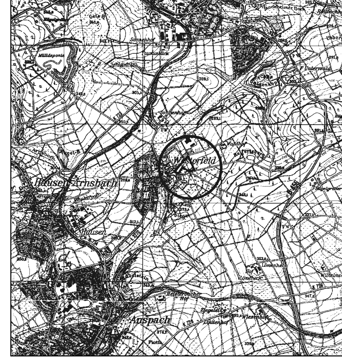
Übersichtskarte (Maßstab 1 : 25.000)

Bestätigung der Vermerke 1-6. Neu-Anspach, den _____ Bürgermeister 7. In-Kraft-Treten gemäß § 10 Abs. 3 BauGB: Der Bebauungsplan wurde am _____ ortsüblich gemacht. Damit hat der Bebauungsplan Rechtskraft erlangt. Neu-Anspach, den _____ Bürgermeister