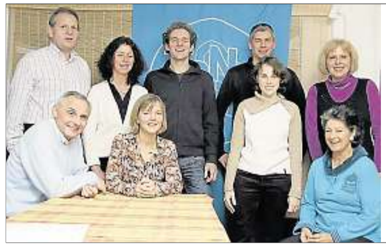
Der Vorstand des Neu-Anspacher Tennisclubs TCA.