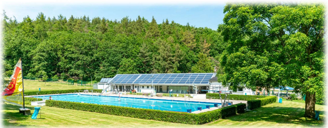
Das Freibad mit dem Schwimmbecken bis Herbst 2023