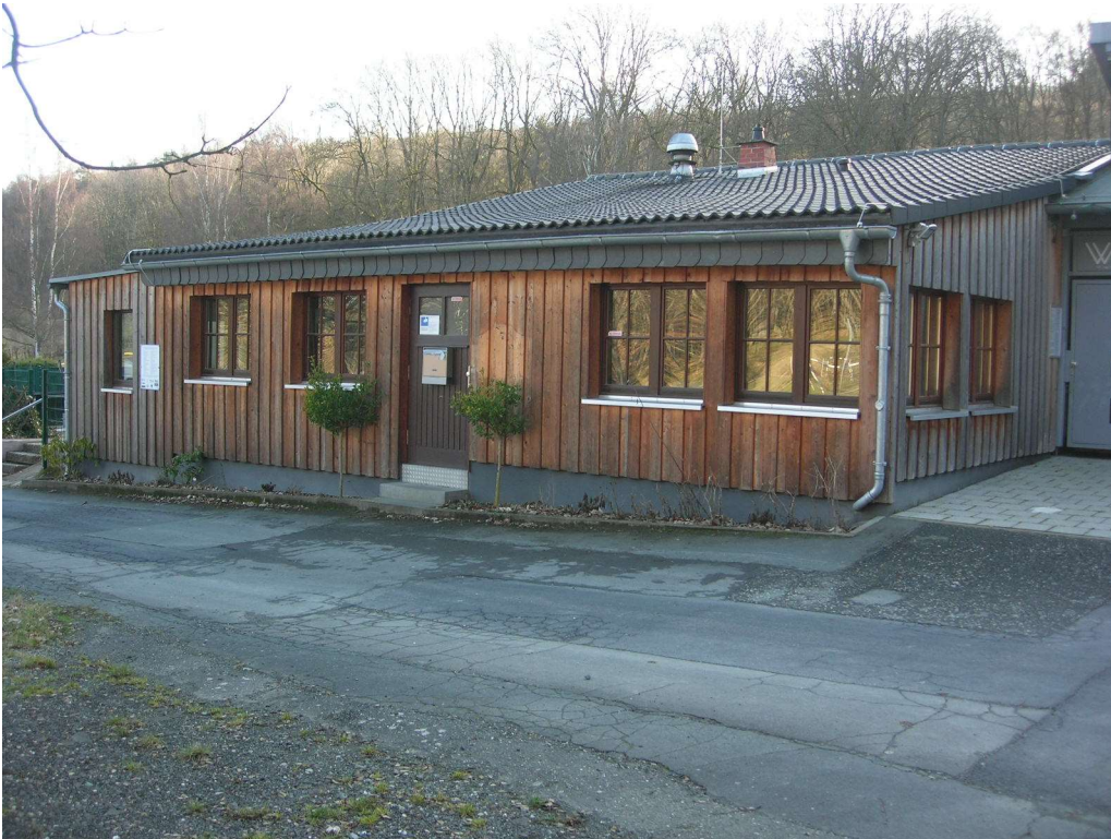
Gastronomie von außen

Die Einrichtung ist Eigentum der Stadt Neu-Anspach. Kleininventar wie Tassen, Teller, Gläser etc. sind nicht vorhanden und müssen vom Pächter angeschafft werden. Ebenso ist eine Kaffeemaschine nicht vorhanden.