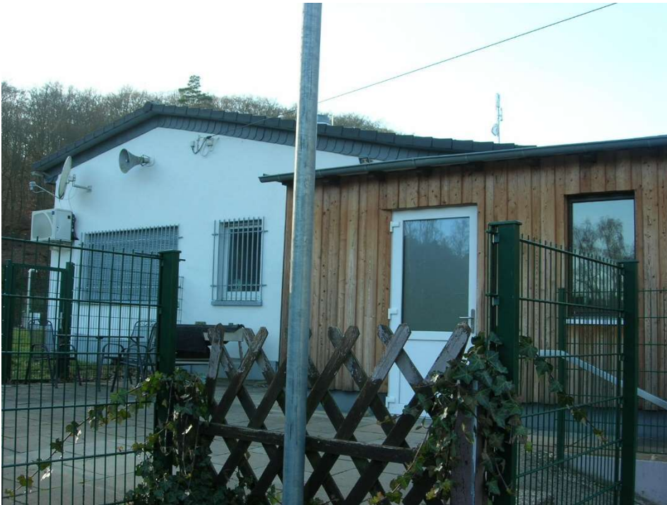
Ausgang Windfang aus Gastronomie zur Terrasse