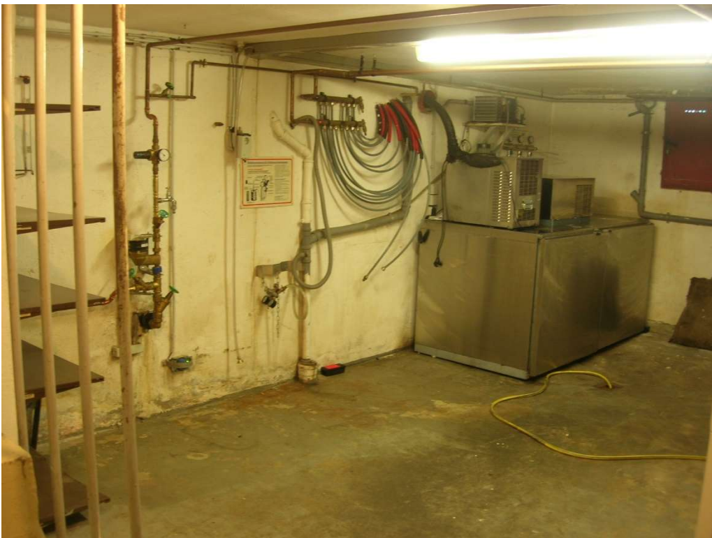
Kellerraum mit Kühlanlage