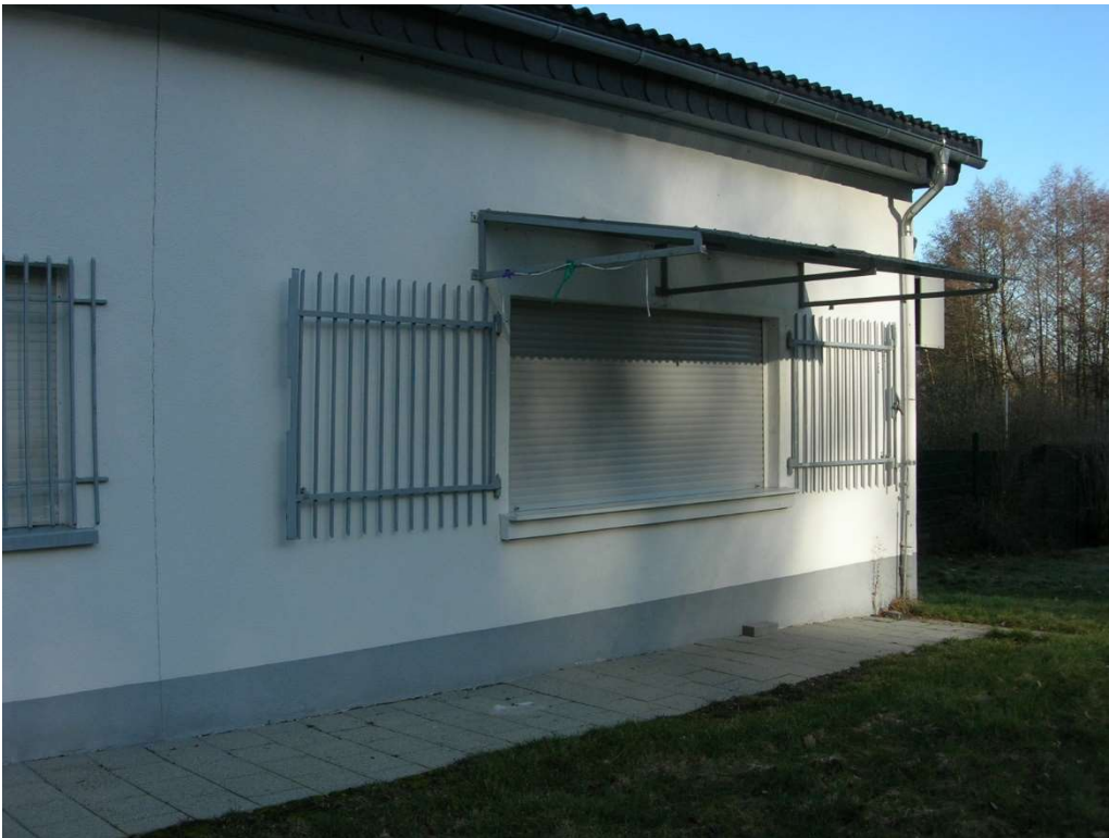
Kiosk Ausgabe im Waldschwimmbad