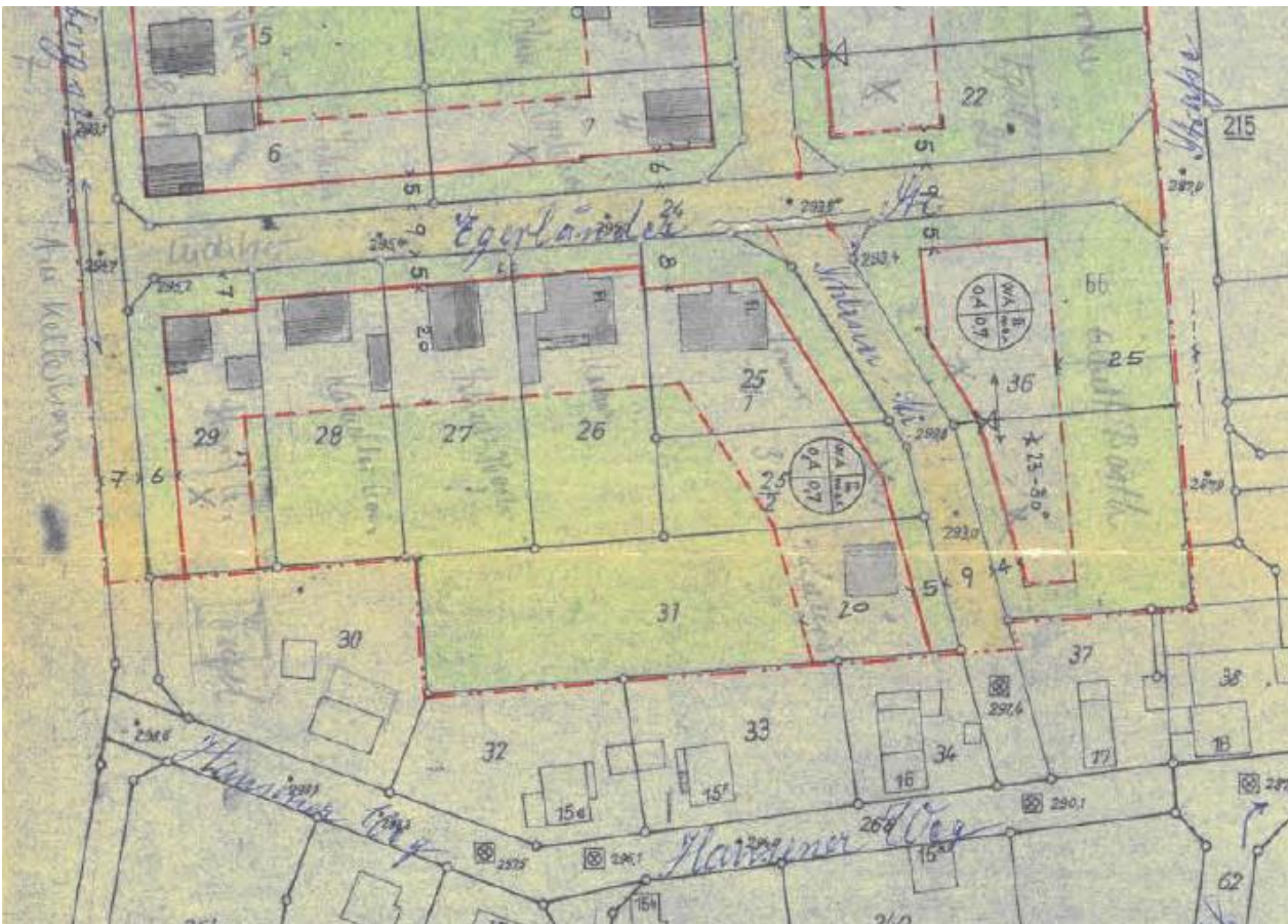
Ausschnitt aus dem Bebauungsplan „Am Bächweg“, unmäßiglich

Der ursprüngliche Bebauungsplan „Am Bächweg“ setzt eine Baulinie in 5, 7 oder 8 m zur Luditzer Straße bzw. zur Schlesier Straße fest. Das Baufeld des Allgemeinen Wohngebiets wird im rückwärtigen Bereich durch eine Baugrenze in einer Tiefe von 20 m begrenzt. Für die sich daran anschließenden rückwärtigen Grundstücksteile trifft der Bebauungsplan die Festsetzung „nicht überbaubare Grundstücksflächen“. Lediglich für das Grundstück Luditzer Straße 9 ist der rückwärtige Grundstücksbereich zur Bebauung freigegeben, da dieser auch durch die Straße „Am Kellerborn“ erschlossen ist.